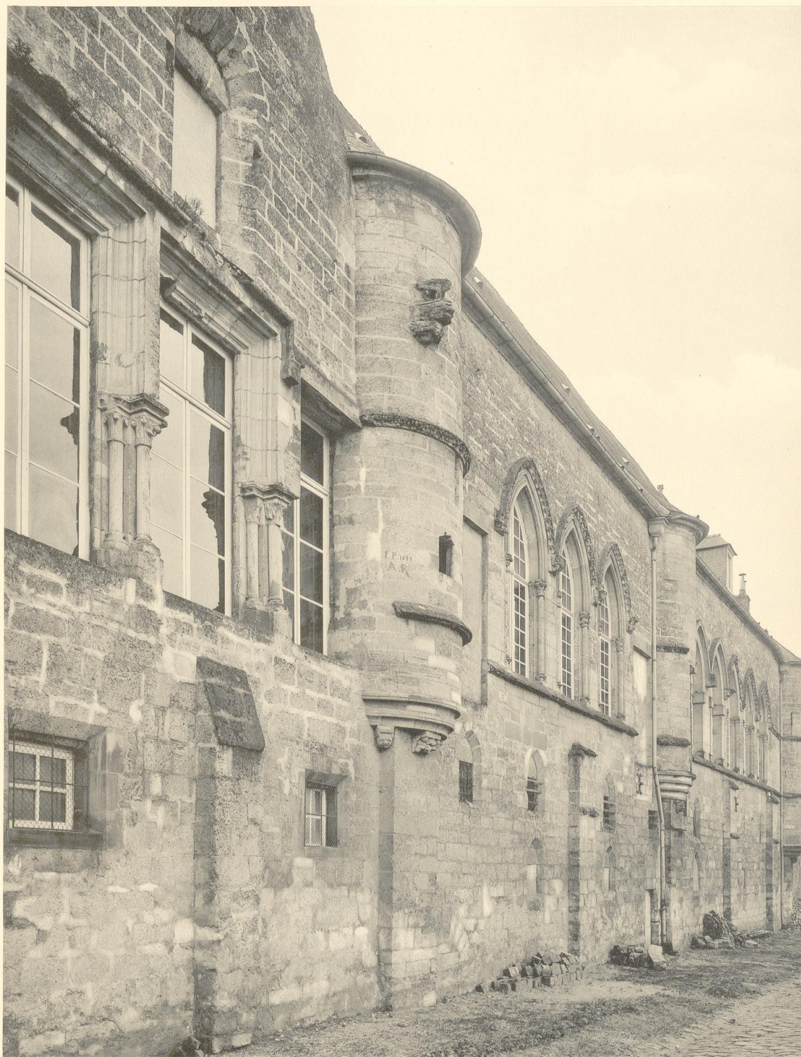
LAON. ANCIEN PALAIS ÉPISCOPAL (aujourd'hui Palais de Justice). Façade sur les remparts. XIII e et XIV e siècles.

Reproduction interdite Copyright by Ch. Eggmann, 1912