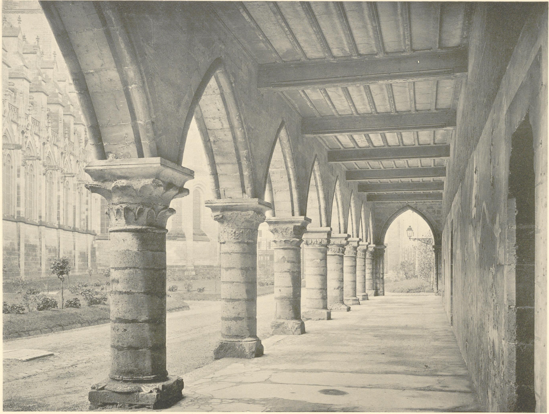
LAON. ANCIEN PALAIS EPISCOPAL (AUJOURD'HUI PALAIS DE JUSTICE). Portique sur la cour. XIII e et XIV e siècles.

Reproduction interdite. Copyright by Ch. Eggmann, 1911.