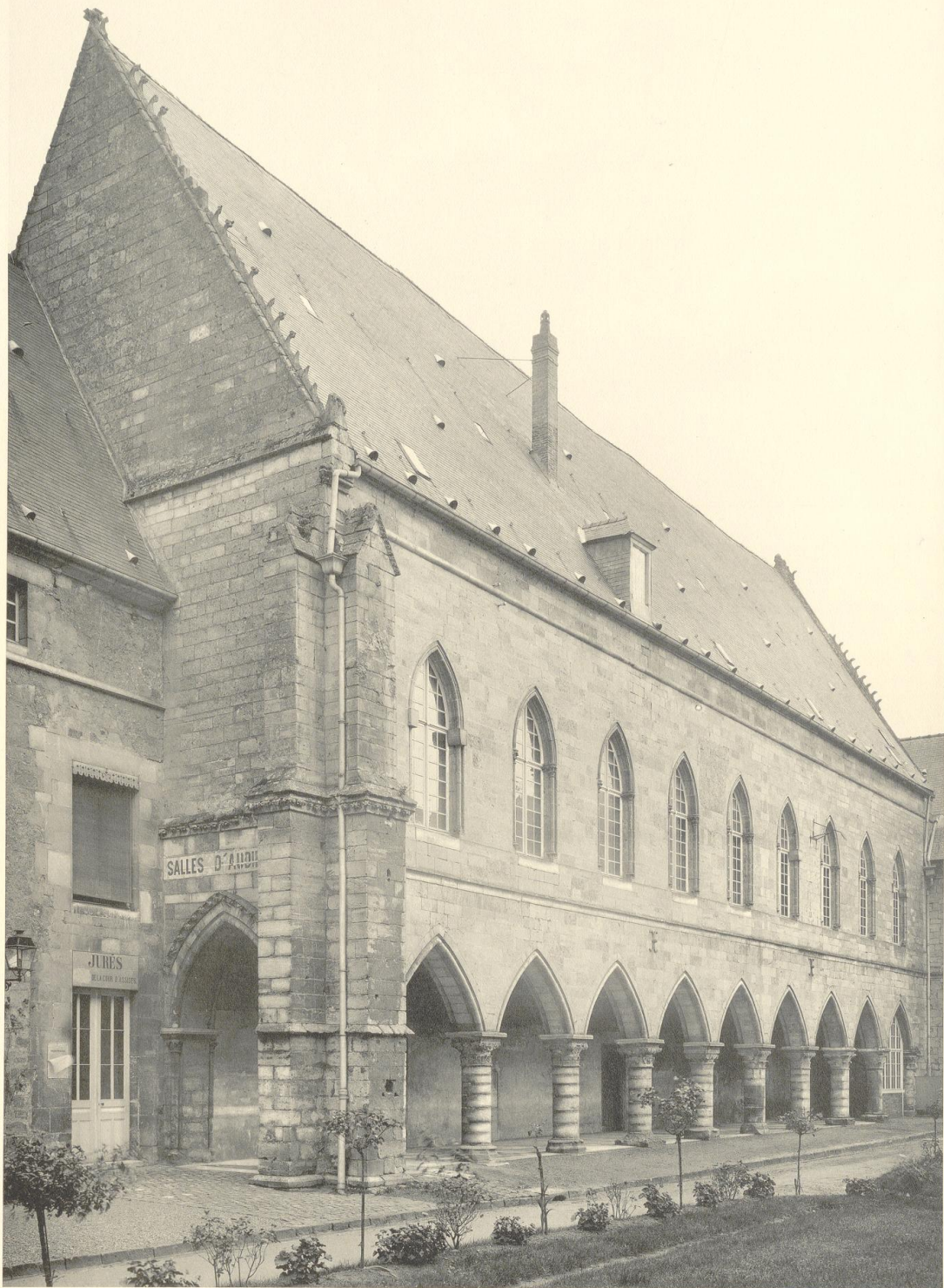
LAON. ANCIEN PALAIS ÉPISCOPAL (AUJOURD'HUI PALAIS DE JUSTICE). Façade sur la cour. XIII e et XIV e siècles.

Reproduction Interdite Copyright by Ch. Eggimann. 1911