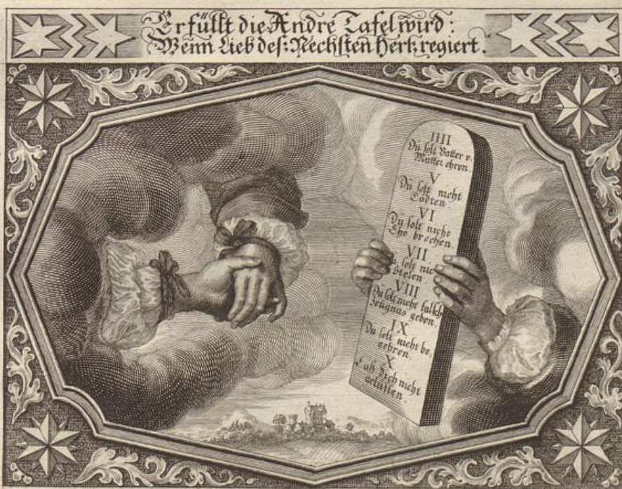
G. Strauch del.