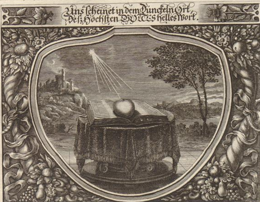
J. Strauch del.

Solche wird beschrieben von dem heiligen Apostel Paulo / aus der 2. Petr. im 1. Cap. Vers. 16.-21.