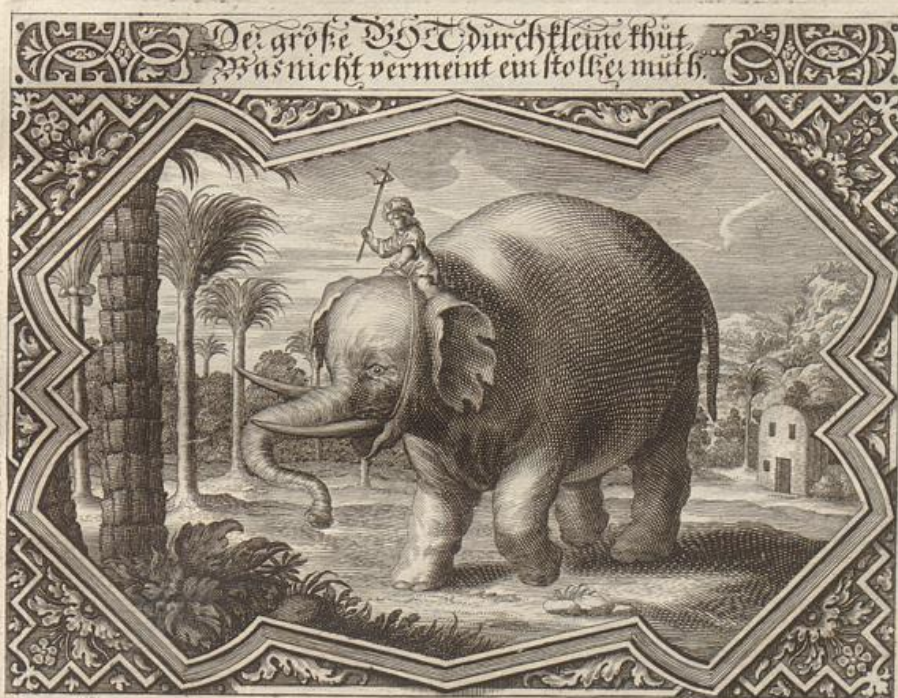
J. Strauch del.

Solche wird beschrieben von dem heiligen Apostel Paulo/ aus der 2. an die Cor. im 11. v. 19. - 33. und 2. Cor. 12. v. 1. - 9.