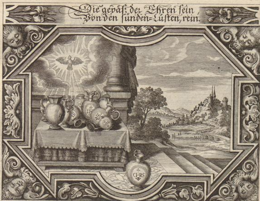
J. Strauch del.

Solche wird beschrieben von dem heiligen Apostel Paulo / in der 1. an die Thessal. im 4. Capit. v. 1.---8.