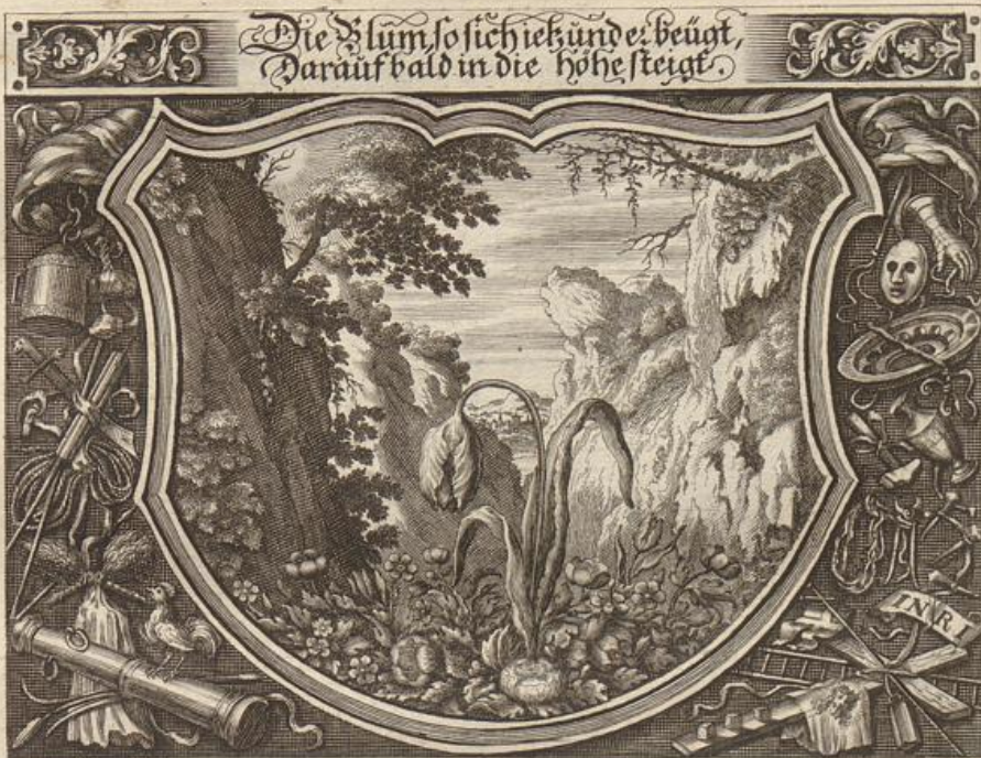
Georg Strauch del.

Solche wird beschrieben von dem heiligen Apostel Paulo / an die Phil. im 2. cap. v. 5 -- 11.