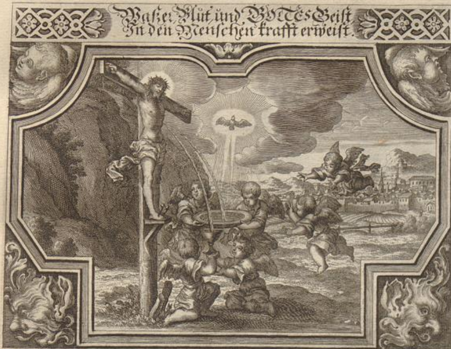
J. Strauch Del.

Solche wird beschrieben/von dem heiligen Apostel und Evangelisten Johanne/in seiner 1. Epistel/ im 5. Cap. Vers. 4-10.