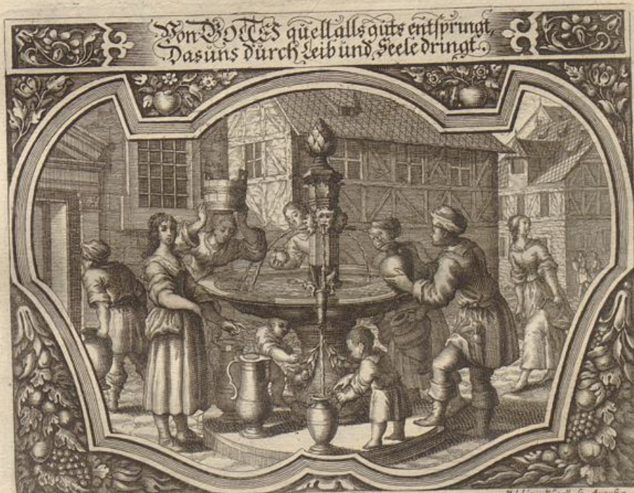
Jong Strauch del.

Solche wird beschrieben/von dem heiligen Apostel Jacobo / in seiner Epistel / im 1. Cap. Vers 17. - 21.