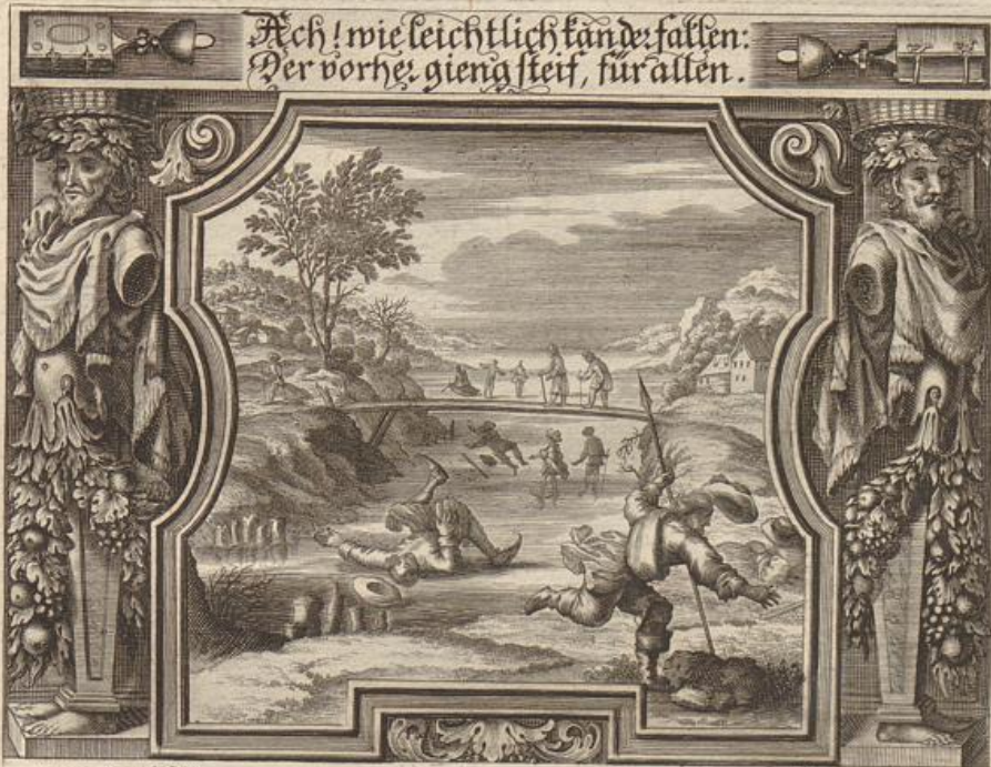
Georg Strauch del.

Solche wird beschrieben / von dem heiligen Apostel Paulo / in der 1. an die Corinth. im 10. Cap. Vers 1. -- 14.