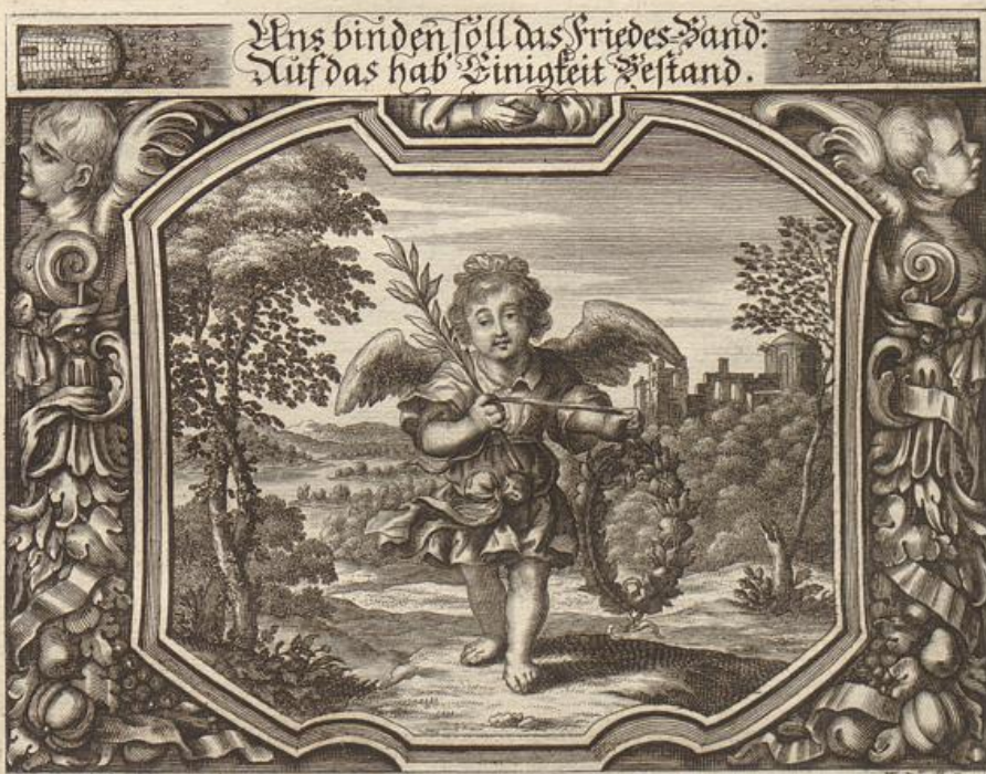
S. Strauch del.