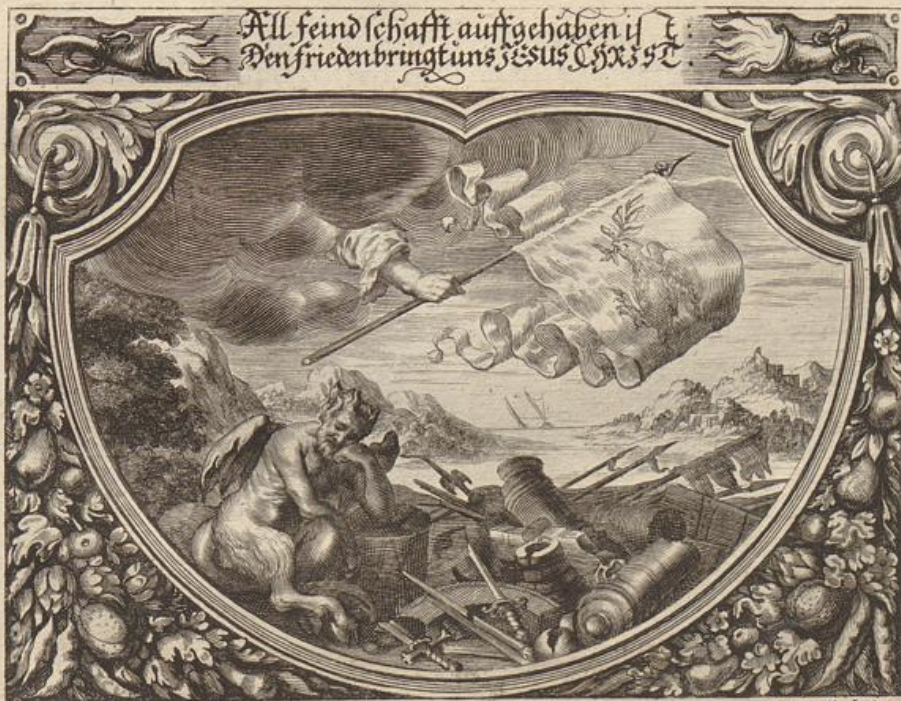
Georg Strauch del.

Solche wird beschrieben/ von dem heiligen Apostel Paulo / an die Colosser / im 1. Cap. Vers 9. -- 14.