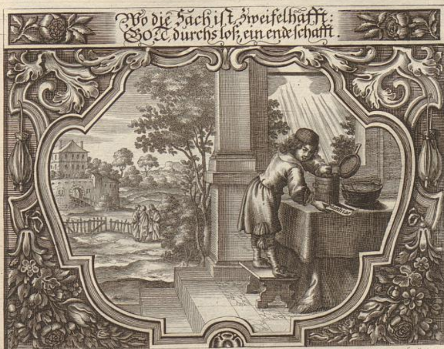
M. Knecht dr.

Solche wird beschrieben/in der Apostel Geschicht / in dem 1. Cap. Vers 15. -- 26.