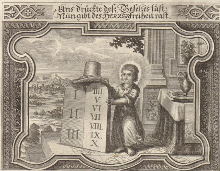
J. Strauch del.

Solche wird beschrieben von dem heiligen Apostel Paulo / an die Galater im 4. Cap. vom 1. bisz anden 7. Vers.