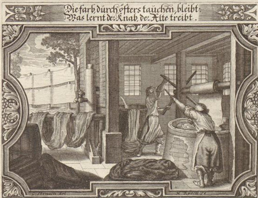
Die farb durch öfters tauchen, bleibt. Was lernt der Knab, der Alte treibt.

Das Evangelium stehet geschrieben / bei dem Evangelisten Luca im 2. Capitel / vom 41. bis an den 51. Vers.