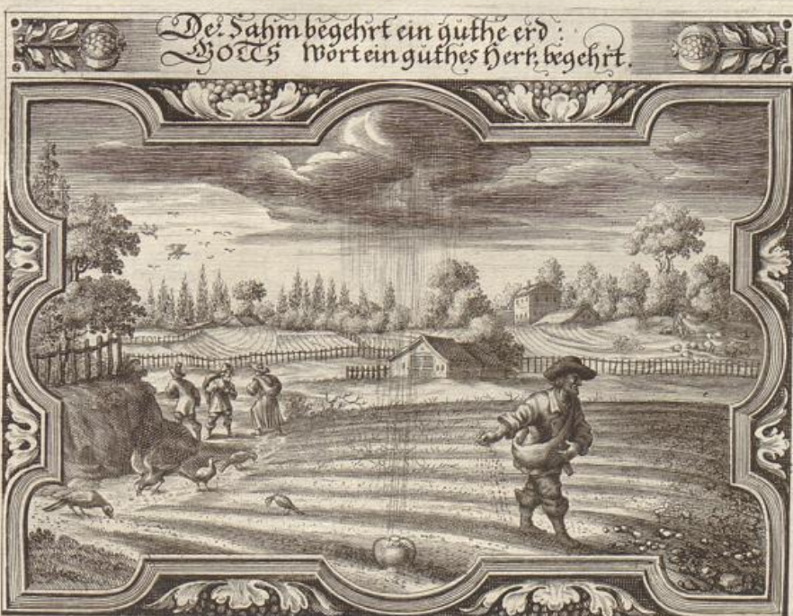
Georg Strauch Del.

Das Evangelium stehet geschrieben / bei dem Evangelisten Luca im 8. Capitel / vom 4. bis an den 15. Vers. Matthæo im 13. Cap. Vers 1. --- 15. Marco im 4. Cap. Vers 3. --- 20.