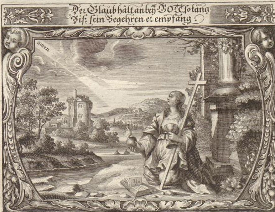
G. Struich del.

Das Evangelium stehet geschrieben/ Bei dem Evangelisten Matthæo/ im 15. Capitel/ von 21. bis an den 28. Vers. Marco 7. Cap. V. 24. -- 30.