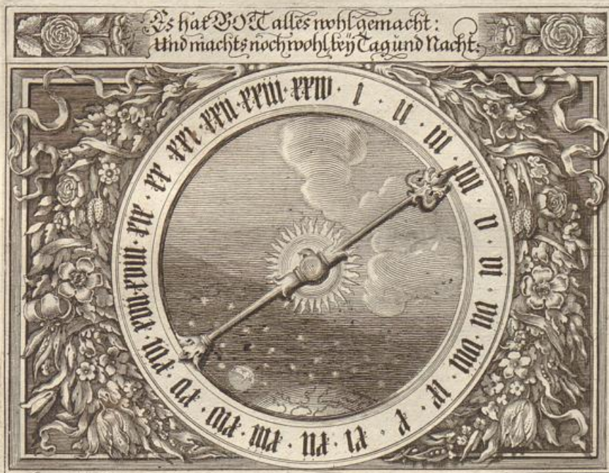
G. Strauch del.

Das Evangelium wird beschrieben / von dem Evangelisten Marco / im 7. Cap. v. 31 --- 37.