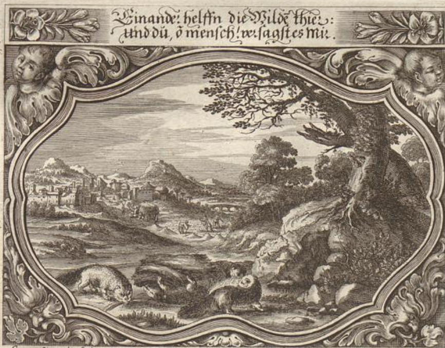
Georg Strauch del.

Das Evangelium wird beschrieben / von dem Evangelisten Luca / im 10. Cap. v. 23 --- 37.