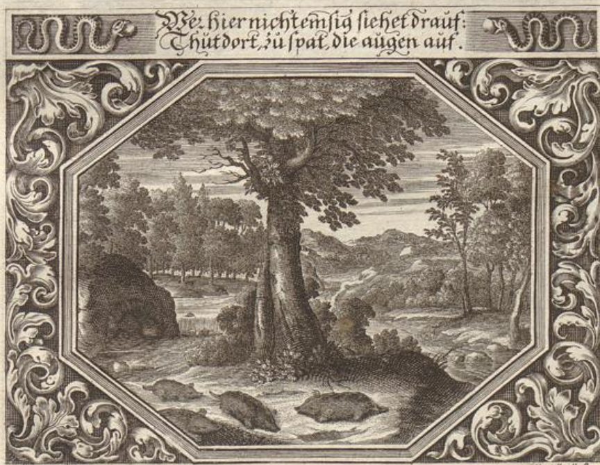
G. Strauch del.

Das Evangelium wird beschrieben / von dem Evangelisten Luca im 9. Capit. vom 41. bis an den 48. Vers. Matthæo 21. v. 12--14.