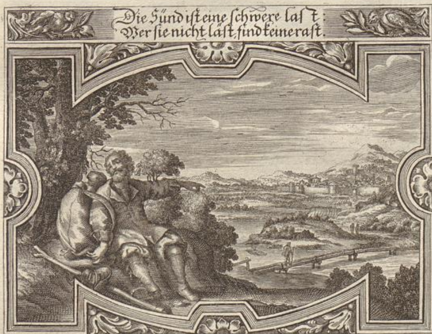
G. Strauch del.

Das Evangelium stehet geschrieben/ bei dem Evangelisten Luca/ im 18. Cap. vom 9. bis an den 14. Vers.