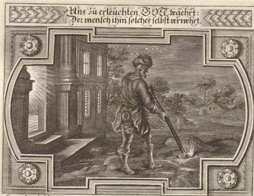
Georg Strauch del.

Das Evangelium wird beschrieben/von dem Evangelisten Matthæo/im 22. Cap. v. 1--14.