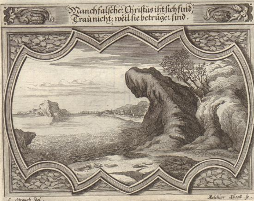
J. Strauch del.

Manchfalsche Christus ist sich find; Traücht: weil sie betrüger sind.