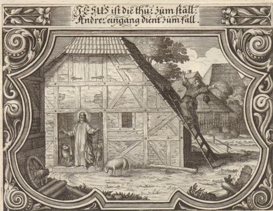
Georg Strauch del.

Das Evangelium wird beschrieben / von dem Evangelisten Johanne / in dem 10. Cap. v. 1 -- 11.