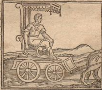
Bulla triumphantium gestamen.

C Rat & triumphantium gestamen Bulla, quam in triumphis praese gestabant, inclusis in eam remediis, quae adversus invidiam pollere credebantur. Illud adnotandum ex Asconio, Bullam suspendi in collo infantibus, ingenuis auream, invenio etiam apud alios argenteam, libertinis vero scorteam, esse solitum, ut illud apud Juvenalem aperitur, Signum de paupere loro. Sane nostrae etiam aetatis mos est, ut si quis torquem aureum, catellamve gestare voluerit, neque tamen equestri, vel, ut ajunt, militari, aut alia quapiam dignitate, cui gestamen illud competat sit insignitus, ligulam ex loro gestamini ejusmodi alligare compellatur.