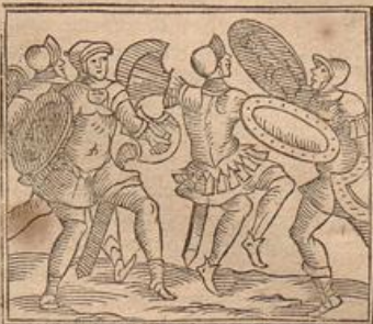
Ochi Regis crudelitatis

Id vero præcipuum ejus erat hieroglyphicum, ut pro crudelitate poneretur, cujusmodi nuncupatione Ægyptii Ochum appellare soliti sunt, qui quidem Persarum Rex omnium crudelissimus, ac maxime formidabilis, cæde omnia sedavit, quacunquē per Ægyptum progredere, quodque apud eos inexpiabile facinus habebatur, Apin ipsum jugulavit, & amicis epulandum apposuit, atque ita universam Ægyptum unius animalis cæde luctuosam fecit, tanto is odio gentem eam persecutus est.