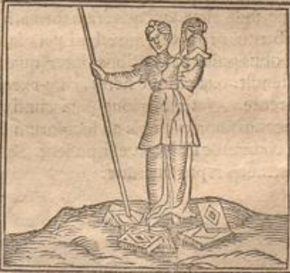
Sic Græci πάλαιον vobis di- unt.

E t Thelesillæ Archivæ poeticis studiis claræ statuam se vidisse Pausanias affirmat, quæ una manu galeam, altera velitarem hastam teneret, libris circa pedes appositis : ob præclarum scilicet facinus, quod illa castis acie ad unum Argivis à Cleomene Spartanò, senes & pueros armatos mœnia tueri iusserit, ipsa cum valida mulierum manu hostem ad urbis direptionem incurstantem exceperit, fuderit, fugaveritque.