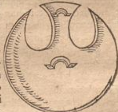
En. lib. 6.

Q uae in secunda, orbicularis fieri consuevit. Tum etiam coribus, cum pelta primae caeruleo color est, in alba parma: secunda vero, purpurea in parma ipsa caerulea: in utraque vero pelta aureus umbilicus.