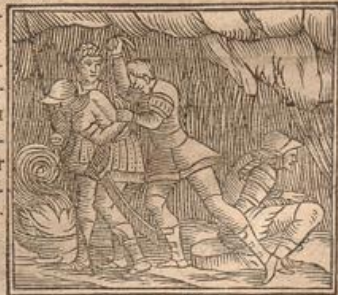
A Macro. lib. 3. cap. 3. Saturn.

ET Penates, qui apud Romanos tanta religione colebantur, armatos, hastatos quippe fuisse, memoria proditum est. Dionysius enim duos ait adolescentes fuisse militari habitu, & vetusto opere, qui sederent, & pila in manibus tenerent, cujus rei testimonium titulus subesset, DII PENATES. Eos Nigidius putat esse Apollinem & Neptunum, quod in Apolline calor & ariditas, in Neptuno humor & frigus intelligatur, quæ nostræ compositionis principia perhibentur. Et quoniam Penatibus magnorum deorum cognomentum attributum est, unde Maronianum illud: