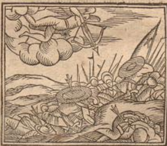
D. Sebast. tutelaris pestilentie.

Sagittas autem Apollinis in Græcos immittas, pestilentiam manifestissime significasse nulli dubium, de quibus late apud Homerum. Hæ vero hieroglyphice solares radios indicant corrupto cæli tractu contagem illam dispergentes. Et Christiana pietas è divinorum numero Sebastianum sagittis impetitur, dum Christo fidei testimonium præstat, adversus pestilentiam sibi tutelarem proposuit.