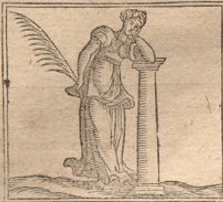
Caryati- dum nomi- ne intelligit statuas mu- liebres in columnis: mimicit Plin. l. 36. cap. 5. Columna bellica.

Liqua etiam columna belli significatum habuit, ut quæ Romæ olim erat ante Bellonæ templum, super quam quotiescunque bellum cuiquam indiceretur, hastam jaciebant, ejus scilicet ominis causa, quod spes esset per hujusmodi susceptum bellum, aut hostes a finibus summovendi, aut ultra præscriptos fines imperium proferendi. Ea autem columna Bellica dicebatur.