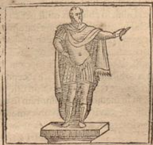
ἀγυιεύς columna ante fores stans, in summa parte a- cua.

Ignibus odoris ara Agyiena nitent, Suffitu balantes myrrha lacrymas barbaro.