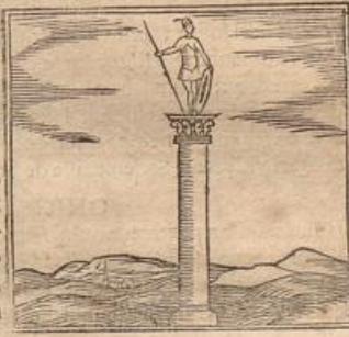
Hinc Pindarus in Olympiis, Hælorem inexpugnabilem & immobilem columnam vocat. Trajani & Hadriani columna.

IN sepulcris vero, neque non monumentis reliquis, columnarum ratio fuit, ut cuius nomini dicatæ essent, gloria supra cæteros mortales attolleretur. Hinc illa Ennii de Scipione verba: Quantam statuam faciet populus Romanus, quantam columnam, quæ res tuas gestas loquatur? Hinc in argenteo nummo videas columnam, cui mediæ ancile affixum est, urna in summo superposita, duabus hinc & inde laureis appensis, quam senatus Divo Augusto Vespasiano decrevit. Sed ut reliquas præteream: duæ adhuc Romæ visuntur, quæ Romæ potentiæ atque splendoris testimonium faciunt, Trajano una, altera Hadriano erecta, summam quarum altitudinem, quæ admodum excelsa est per interiores gradus coclitis in modum circumductos commodissimus est ascensus: non enim in re tam omnibus obvia nobis immorandum est. Decretæ autem in columnis statua à Senatu plerisque fuerunt, quos enumerare, nostri non est instituti rerum enim quæ tractandæ sunt multiplicitas breves nos esse cogit. Illud admonuero, quod apud Plinium legitur, Senatum Galbæ ut primum licitum fuit statuam decrevisse rostratæ columnæ superstantem, placere nonnullis ut striatæ legatur. Antiquam autem esse celebritatem statuarum in columnis, ex eo manifestum, quod C. Menenius supra columnam statua dicata est, qui Latinos priscos deiecerat una cum Camillo collega, quæ res, inquit Livius, rara illa ætate fuit. Et illa adeo celebris Trajani columna colossum habuit superimpositum, cuius rei fidem faciunt ejus numi.