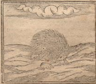
Aristot. de partibus animal. lib. 4. c. 5. Plin. lib. 9. cap. 31. Echini terrestres speciei duæ.

Atque hoc tam prudens alioqui animal in opportunitate captanda, & periculis evitandis ingenio & natura præmunitus, damni tamen alicujus, ob procrastinationem ingruentis, hieroglyphicum est, si illi fetus adjicitur suus. Id enim malum ex contatione majus effectum ostendit, propterea quod alvo stimula quamdiu potest partum differt, quo fit, ut fetus magis inolefcens, majorem postmodum in pariundo dolorem afferat. Duo ejus genera omnino sunt, maritimum & terrestre, utrique nomen apud Græcos ἐχίνῳ. Terrestris, de quo jam diximus omnibus innotuit sub Erinacii nomine. Hujus quoque