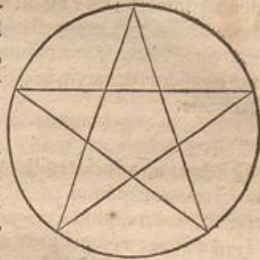
Sic Lucian pentagoni salutis symboli, cuius agitur de quodâ, qui lapsus erat inter salutandum.

deditum rebus ex illibus his legendis occupare. Sed illud minime dissimulare possum, posse nos in verâ salutis significatum accipere quinque Christi vulnera, pectoris unum, manuum duo, totidè pedum, quæ in propatulo posita pentalpha ipsum commode constituent : patefactis enim manibus, quæ deorsum à lateribus porrigantur, pedibusq; ipsis modicum divaricatis, puncta æquidistantia quatuor assignantur, quintum vero in ipso pectore costas inter : à quibus punctis lineæ quinque numero æquales omnes, quæ altera alterius punctis se contingant, \pi\epsilon\psi\alpha faciunt, duæ quippe à pectore ad utrumq; pedem duæ alteræ in chiasmi ferè modum decussatæ à dextera manu ad pedem laevum, atq; à laeva ad dexterum, quinta ab alterutra manu ad alteram. Neq; \pi\alpha\tau\epsilon\rho\sigma\tau\omega\upsilon id fuerit, si quæ