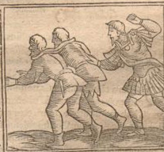
Jugum Domini suæ.