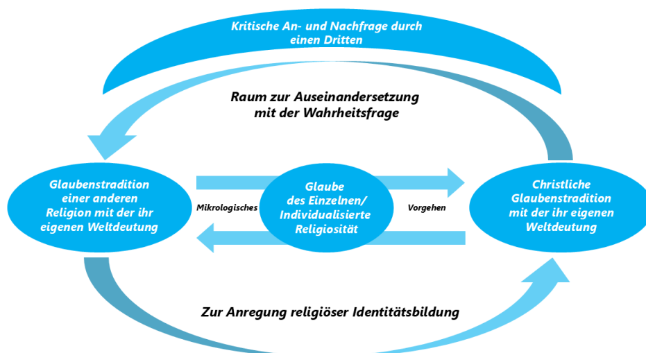
Abb. 3: Lehr- und Lernraum einer komparativ-theologisch ausgerichteten Religionsdidaktik (Grafik: Monika Tautz)

Die dritte Grafik will aufzeigen, worauf eine komparativ-theologisch inspirierte Didaktik achtet: