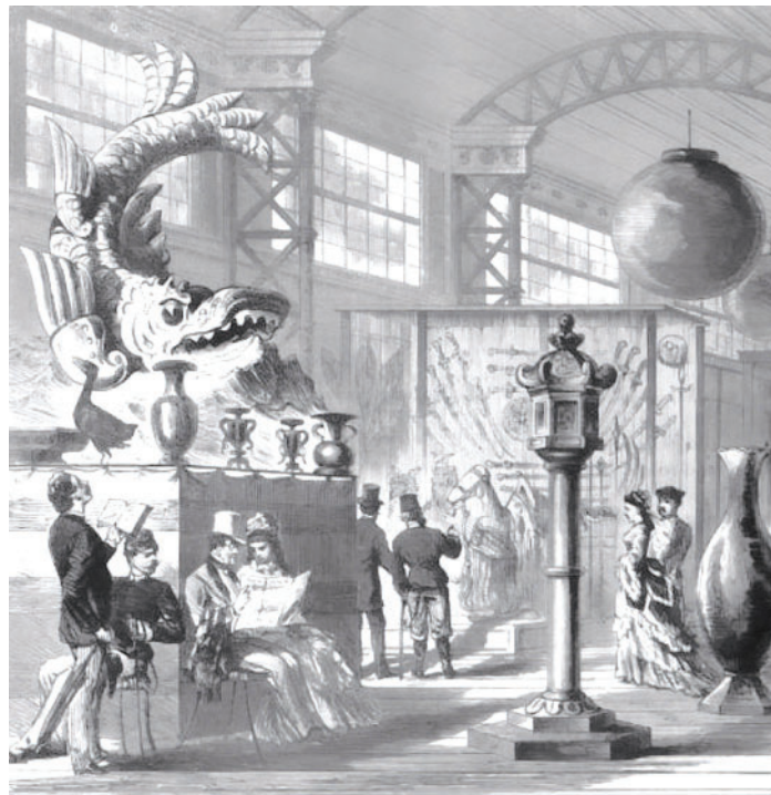
Wiener Weltausstellung: In der japanischen Galerie. Nach einer Zeichnung von H. Fritzmann.

Die Tradition des kaiserlichen Japans wurde durch die Präsentation der Kronjuwelen in der Ausstellung groß in Szene gesetzt. Dabei wurde die Dauer der Kaiserdynastie betont, die zum Zeitpunkt der Ausstellung ihren 123. Herrscher stellte. Dass die kaiserliche Regierung seit etwa 800 Jahren nur repräsentative Funktionen hatte und Japan sich jüngst in einer Zeit politischer Umwälzungen befand, ließ sich anhand des Ausstellungsbeitrags nicht erahnen. Zudem wurden für das Publikum verschiedene Feste veranstaltet, deren jahrhundertalte Tradition und Verankerung in der japanischen Kultur explizit betont wurden. 41