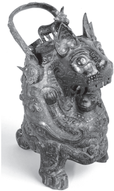
Abb. 1: Bronzegefäß, Typ You , „La Tigresse“, 11. Jahrhundert v.u.Z., Musée Cernuschi, Paris Objektnr. M.C. 6155.

Spielart des pan-eurasischen „Herr oder Herrin der Tiere“-Motivs deuten, 16 wobei in China der Status des Herren oder der Herrin vom Menschen auf das Tier übergegangen zu sein scheint. Berühmte Träger des „Tigermaul/Menschenhaupt-Motivs“ sind zwei in das 11. Jahrhundert v.u.Z. datierte Bronzegefäße vom Typ You zur Bewahrung von zeremoniellem Wein für die königliche Ahnenverehrung. 17 Ein Exemplar dieser skulpturenhaft anmutenden „Tiger-frisst-Menschen-you-Gefäße“ 18 befindet sich in der Obhut des Musée Cernuschi in Paris, 19 das andere im Sen-Oku Hakukokan Museum in Kyoto. 20 (Abb.1) Dargestellt ist ein dem Taotie verwandtes tigerähnliches Raubtier mit spitzen Ohren. Mit seinen Vorderpfoten umklammert es eine deutlich kleinere, schwächling wirkende menschliche Figur. Diese steht mit gespreizten Beinen auf den Hinterpfoten des Raubtiers. Der zur Seite gedrehte Kopf droht im Rachen zu verschwinden.