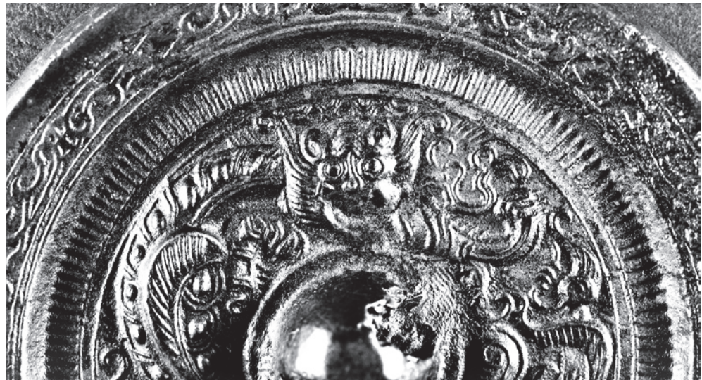
Abb. 4: Detail von Abb. 2 a.

Der beim Betrachten des inneren Reliefdekors gewonnene Ersteindruck ist der eines chaotisch-dynamischen Geschehens, eines Ineinanderfließens von Linien und Formen analog zum verwoben-verworrenen Dekor des Spiegelrands. Erst beim zweiten Hinsehen lassen sich Strukturen und Figuren erkennen: Den Großteil der Bildfläche nimmt ein numinoses Wesen ein, das wie ein entfernter Verwandter des Taotie und der von den oben besprochenen Shang-zeitlichen Gefäßen verkörperten tigerhaften Raubtieren erscheint. Sein in höherem Relief dargestelltes und damit betontes Gesicht bildet den Mittelpunkt des Geschehens. Mit seinen großen runden Augen ist es geeignet, den Blick des Betrachters immer wieder auf sich zu ziehen – eine Eigenschaft, die es mit dem Taotie auf Shang-zeitlichen Bronzegefäßen gemein hat. Regelrecht provozierend wird der Blickkontakt eingefordert. Das Objekt an sich erhält dadurch einen belebten, geradezu magischen Charakter. (Abb.4) Ferner erkennbar sind ein zur äußersten Anspannung gekrümmter Rücken, vier wirbelnde Läufe, daran Pranken mit Krallen, ein katzenähnlicher Schwanz. Der Eindruck, dass es sich um einen Tiger handeln könnte, wird durch das auf Rücken, Gliedern und Schwanz angebrachte Muster aus Streifen, Noppen und Ringpunkten verstärkt. Allerdings ist es keine gewöhnliche Raubkatze, sondern eine für die Zeit der Östlichen Han-Zeit typische Darstellung eines Drachen.