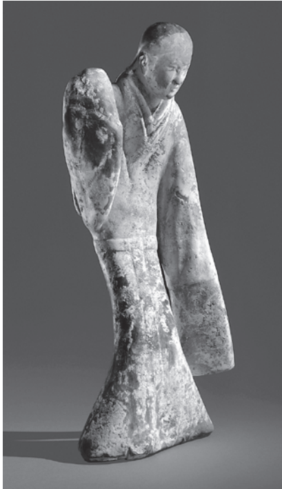
Abb. 7: Grabfigur einer Tänzerin, bemalte Irdenware, 2. Jahrhundert v.u.Z., Metropolitan Museum of Art, New York, Objektnr.1992.165.19.

Die Blicke gehen jeweils im 90-Grad-Winkel aneinander vorbei. Bei den Gefäßen steht die menschliche Figur mit beiden Füßen auf den Hinterpranken des Wesens, die Arme erhoben, so dass die Hände auf den fremden Schultern ruhen. Ein für die Shang-Kunst typischer Eindruck der Harmonie und des Ineinandergreifens von Mensch und Natur 51 umgibt das ungleiche Paar, trotz des weit aufgerissenen Mauls und der drohenden Gefahr für den Menschen, in diesem zu verschwinden. Auf dem Spiegel sehen wir eine ähnliche, aber erheblich dynamischere Szene. Es findet sich keine enge Umklammerung. Die menschliche Figur scheint auf nur einer der beiden Hinterpranken zu stehen oder von dieser gepackt zu sein. Nur einer ihrer Arme ist erhoben und weist in Richtung Tiger-Drache. Das lässt Raum für Deutungen: Handelt es sich um eine – aufgrund der dargestellten Kräfteverhältnisse freilich aussichtslose – Geste der Abwehr gegen das übermächtige Wesen, dass die am Boden liegende Frau an ihren Füßen und Haaren gepackt hat? Droht diese, vielleicht als chinesische Laokoon-Gestalt, gefressen zu werden?