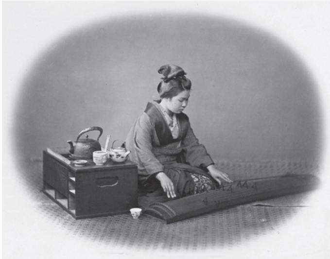
Abb. 1: „Woman with Tea Set Playing the Koto“, Yokohama-Fotografie von Felice Beato, 1860er-Jahre, https://www.metmuseum.org/art/collection/search/291981 , 30.09.2025.

Mönche, Bauern und Lastenträger, manchmal auch um nachgestellte Tee-Zeremonien (Abb.1). Die Abbildungen dienten der Festigung eines spezifischen Japanbildes im Westen: das Traditionsbewusstsein sowie die alten Werte der vorindustriellen, exotischen japanischen Gesellschaft sollten für ein europäisches Publikum sichtbar und sammelbar werden. 23 Da das Medium der Postkarte einer breiten Bevölke-