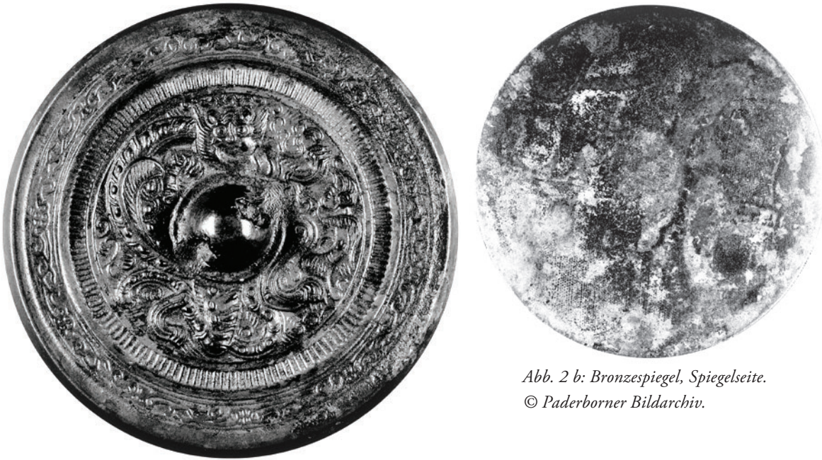
Abb. 2 b: Bronzespiegel, Spiegelseite.

objekten Ostasiens 29 und konnten, wie einschlägige Gräberfunde belegen, schon in der Antike ihren Weg bis nach Osteuropa finden. 30 Sie verfügen über eine glattpolierte und brünierte Reflexions- oder Schauseite, nicht aber, wie die Handspiegel unserer Zeiten und Breiten, über einen Griff. Um einen vergrößernden Effekt zu erzielen, ist die aus einer helleren Legierung bestehende Schauseite konvex. 31 Dies wiederum bedingt die runde Form, wie sie in der Han-Zeit und darüber hinaus üblich war.