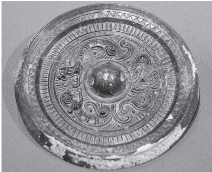
Abb. 5: Bronzespiegel mit kämpfenden Drachen, Östliche Han-Dynastie, Hong Kong Museum of History, China.

Seit dem chinesischen Neolithikum wurden Drachen als Komposit-Wesen konstruiert. Ähnlich dem Taotie sind sie aus Bestandteilen verschiedenster Tierarten zusammengesetzt, denen jeweils eine symbolische Bedeutung zugeschrieben werden konnte. 44 Dabei lassen sich mit Zhu Xiaoli zwei Typen unterscheiden: schlangenähnliche und tigerähnliche Drachen („in the style of mammals“ 45 ), letztere laut Roger Goepper „Mischwesen, die sog. ‚Drachentiger‘“. 46 Diese zeichnen sich, wie das auf dem hier besprochenen Spiegel verewigte Exemplar, durch eine kurze Schnauze, einen Bart, langen Schwanz sowie durch Mähnen an den Gliedmaßen aus. Sie haben in der Regel keine Hörner und finden sich vor allem in der Kunst der Streitenden Reiche sowie der Qin- und Han-Dynastien wieder, das heißt in der Zeit vom 5. Jahrhundert v.u.Z. bis zum Ende des 2. Jahrhunderts u.Z. In späteren Jahrhunderten ging die Verwendung derartiger Tiger-Drachen zurück. Bis zur Song-Zeit sollten sie gänzlich verschwunden sein 47 – bewusst archaisierende Imitationen älterer Stile und Motive freilich ausgenommen. Ein in die Zeit der Östlichen Han-Dynastie datierter Spiegel des