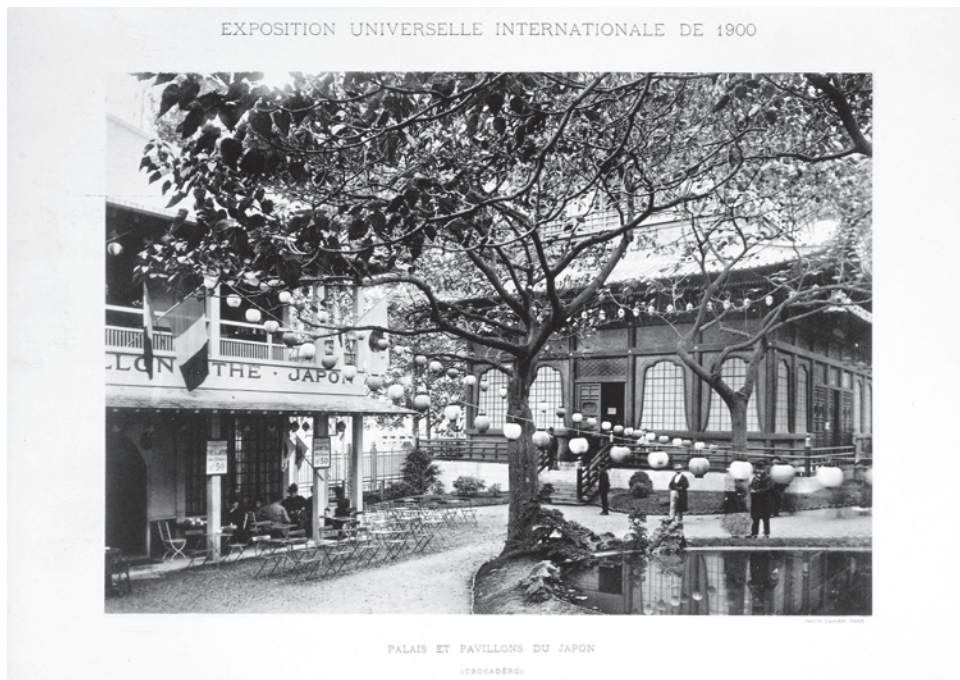
Abb. 3: „Exposition universelle internationale de 1900; Palais et Pavillon du Japon (Trocadéro)“. Im Hintergrund ist der Nachbau des Ginkakuji-Tempels zu sehen. Heute in der Sammlung des Musée Carnavalet, Histoire du Paris, https://www.parismuseecollections.paris.fr/fr/musee-carnavalet/oeuvres/exposition-universelle-internationale-de-1900-palais-et-pavillons-du-japon#infos-principales, 30.09.2025.

Gleichzeitig hätte eine frühere Abkehr vom idealisierten traditionellen Japanbild den kommerziellen Erfolg der Exportgüter gefährdet. 52